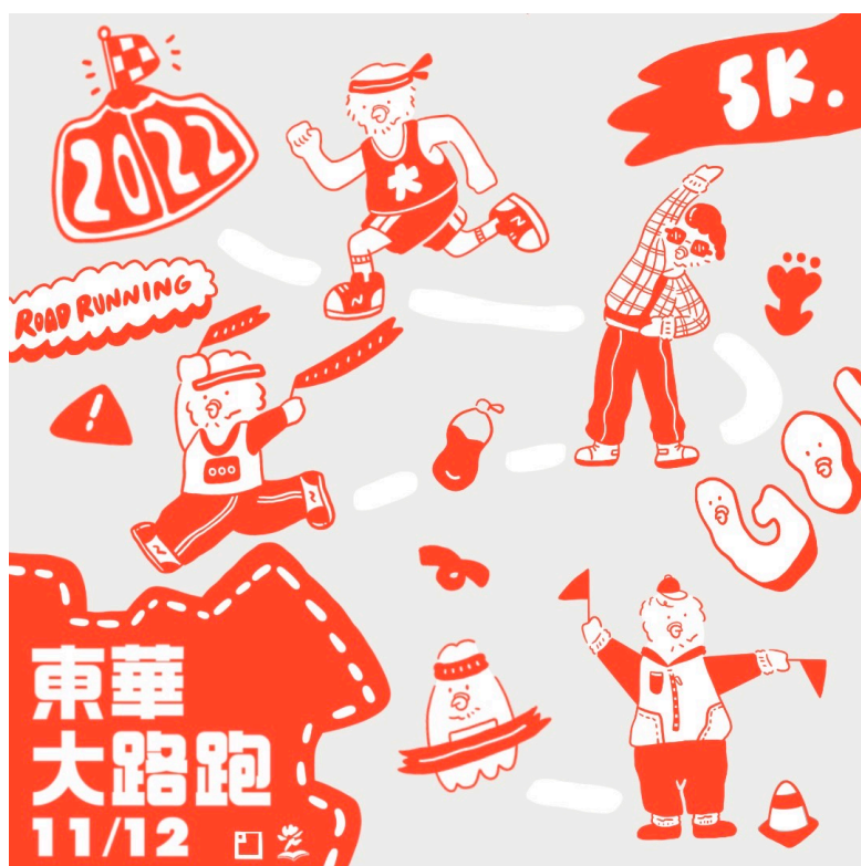
附件二：排汗衫示意圖